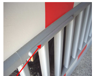
Gute Stapelmöglichkeit, kein verrutschen beim Transport.

Zur Verwendung der Absturzsicherung als Vollsperrung sind für die Befestigung von fünf roten Warnleuchten entsprechende Leuchtenstutzen lieferbar.